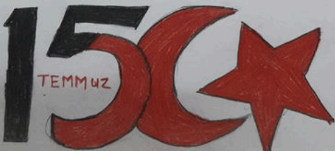
Elif AYDOĞDU 4/A