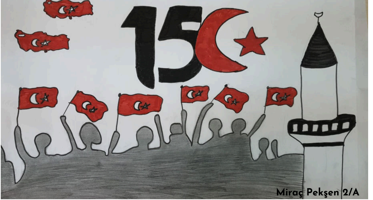
Miraç Pekşen 2/A