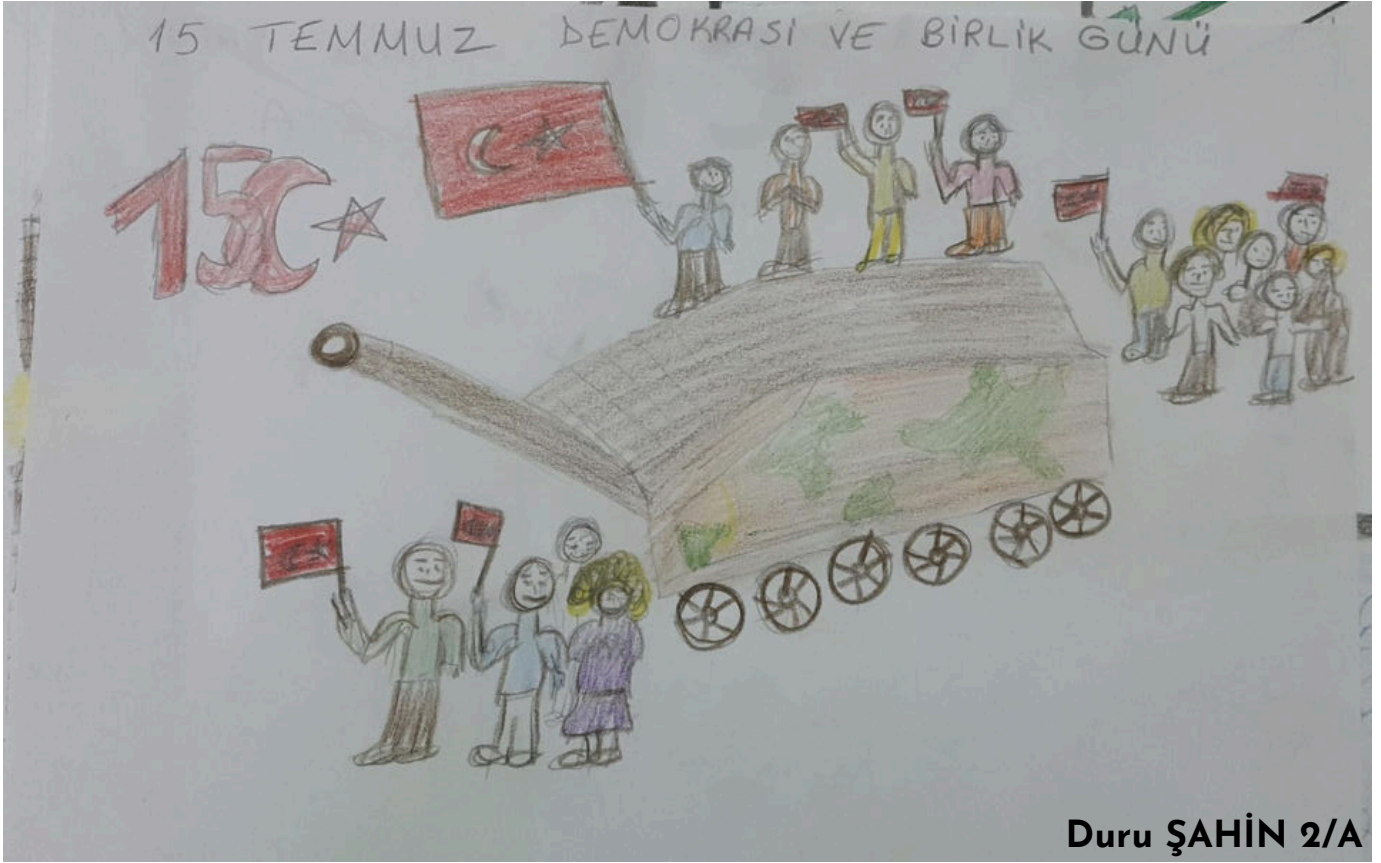
Duru ŞAHİN 2/A